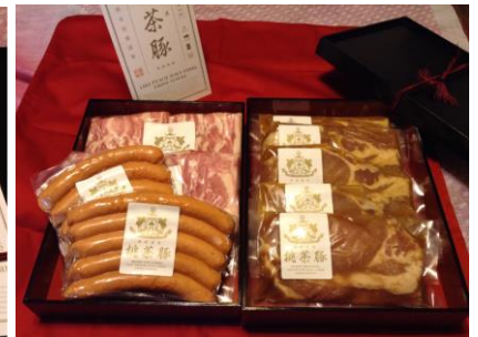
詰合せセット 5000 円