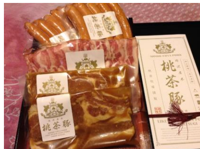
詰合せセット 3000 円