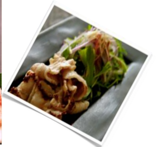
豚味噌漬けは真空個包装です (写真はイメージ)